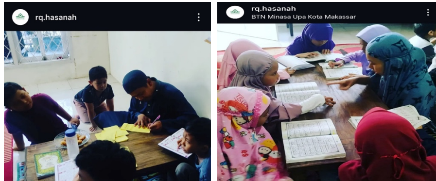
Gambar 4. Aktivitas Kontrol, Halaqah dan Fokus (KhaF) pada Rumah Quran Hasanah

Pembinaan bacaan tulis Al-Qur'an dilaksanakan secara rutin pada hari Senin dan Rabu dengan fokus pada tahsin dan tajwid. Berdasarkan hasil observasi selama kegiatan berlangsung, sebagian besar santri mengalami peningkatan dalam kelancaran membaca Al-Qur'an dan ketepatan pengucapan huruf hijaiyah. Santri yang sebelumnya masih terbata-bata mulai menunjukkan kemampuan membaca yang lebih baik setelah mengikuti pembinaan secara konsisten.