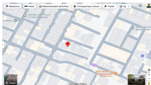
Gambar 1. Lokasi Rumah Quran Hasanah ( https://maps.app.goo.gl/UM9TH69JX7Zm71du7 )

Kegiatan pengabdian kepada masyarakat ini dilaksanakan di Rumah Quran Hasanah selama kurang lebih enam bulan, mulai Januari hingga Juni 2025, kemudian peninjauan hasilnya pada 6 bulan setelahnya yaitu Juli-Desember 2025. Rumah Quran Hasanah dipilih sebagai lokasi kegiatan karena memiliki program pembinaan Al-Qur'an yang aktif dan rutin dilaksanakan bagi anak-anak dan remaja di lingkungan sekitar. Lokasi kegiatan berada pada lingkungan masyarakat yang mudah dijangkau oleh peserta sehingga memudahkan pelaksanaan pembinaan secara berkala, yaitu beralamat BTN Minasa Blok G 19 No. 2, Kota Makassar.