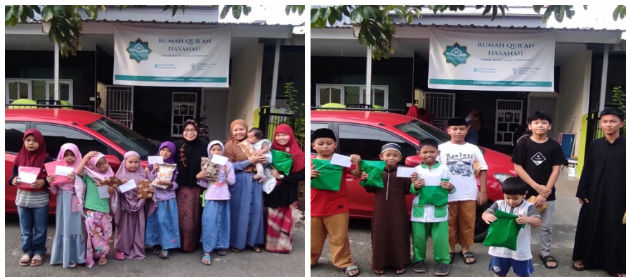
Gambar 7. Pemberian penghargaan dan kebersamaan Santri setelah tes bacaan dan hapalan pada Rumah Quran Hasanah

Pembelajaran berbasis halaqah menjadi salah satu faktor utama keberhasilan kegiatan di Rumah Quran Hasanah. Model halaqah memungkinkan pembina melakukan pendampingan lebih dekat terhadap peserta, baik dalam aspek bacaan maupun hafalan. Pendekatan ini membantu pembina lebih mudah mengidentifikasi kemampuan dan kendala setiap santri.