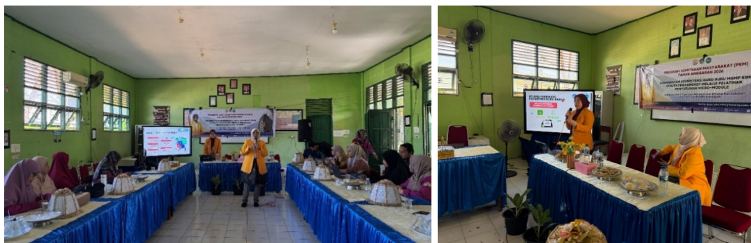
Gambar 2. Pemaparan Materi Penyusunan Micro-module

Indikator peningkatan kemampuan merancang dan menyusun micro-module yang sesuai kurikulum memperoleh skor 4,56 dan 4,48. Data ini mengindikasikan bahwa pelatihan memberikan keterampilan praktis kepada guru sehingga mereka mampu menyusun modul dengan fokus pada satu kompetensi dasar, menyertakan aktivitas pembelajaran yang interaktif, serta instrumen evaluasi yang sesuai. Temuan ini konsisten dengan Lestari (2019), yang menunjukkan bahwa guru yang mengikuti pelatihan pengembangan modul kontekstual mampu meningkatkan kemampuan mereka dalam merancang bahan ajar yang sesuai kurikulum dan mudah diterapkan di kelas.