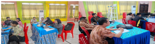
Gambar 2. Pemaparan Materi Konsep Soal HOTS

Setelah dilakukan penguatan konsep mengenai karakteristik HOTS dan prinsip penilaian objektif yang valid, guru mulai menunjukkan peningkatan pemahaman secara konseptual. Hal ini tampak dari kemampuan guru dalam merumuskan indikator soal yang mengarah pada kemampuan analisis, evaluasi, dan pengambilan keputusan. Pada sesi pendampingan penyusunan soal, guru mampu mengembangkan soal dengan stimulus kontekstual yang dekat dengan kehidupan peserta didik, seperti aktivitas ekonomi sederhana dan situasi yang sering dijumpai di lingkungan sekitar.