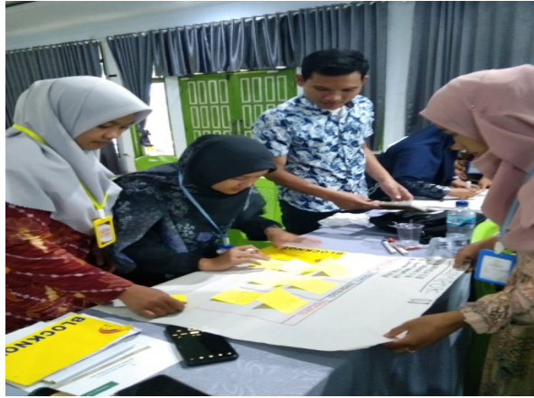
Gambar 1. Diskusi Kelompok

Tahap pelaksanaan kegiatan menghasilkan capaian utama pengabdian yang berkaitan langsung dengan penguatan praktik pembelajaran guru. Pada tahap ini, tiga puluh guru matematika berpartisipasi aktif dalam diskusi kelompok terarah yang dirancang sebagai kegiatan penyuluhan, pelatihan reflektif, dan pendampingan. Guru dibagi ke dalam lima kelompok kerja berdasarkan jenjang dan pengalaman mengajar untuk memudahkan proses diskusi yang lebih fokus.