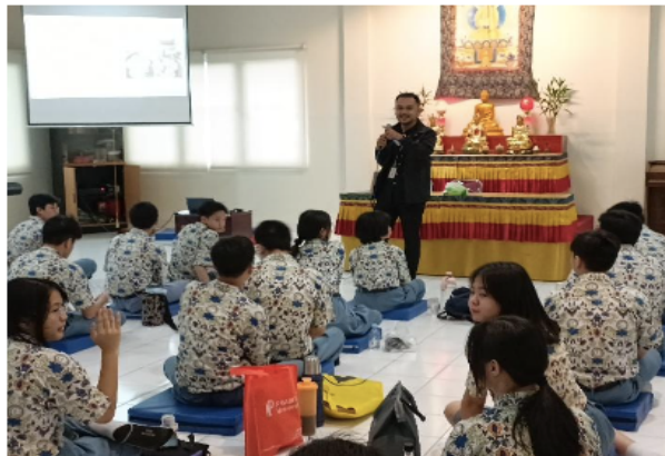
Gambar 2. Pemaparan Materi

Kegiatan Pengabdian kepada Masyarakat ini diawali dengan sesi penyampaian materi sosialisasi yang disampaikan oleh dosen Program Studi Pariwisata Universitas Matana. Sesi ini dirancang sebagai fondasi konseptual untuk membangun pemahaman awal siswa mengenai posisi kuliner Nusantara dalam konteks budaya, identitas nasional, dan tantangan globalisasi. Materi yang disampaikan mencakup pemahaman tentang kuliner tradisional sebagai bagian dari warisan budaya takbenda (intangible cultural heritage), dinamika globalisasi yang memengaruhi preferensi konsumsi generasi muda, serta pentingnya peran pelajar sebagai agen pelestarian budaya.