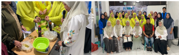
Gambar 3. Praktek pembuatan eco-enzyme kepada peserta pelatihan.

Tahap berikutnya adalah pelatihan pembuatan eco-enzyme. Peserta mempraktikkan langsung proses pencacahan kulit buah, pencampuran dengan gula merah/molase dan air, serta penutupan ember secara rapat untuk menjamin kondisi anaerob. Hasil observasi menunjukkan bahwa sekitar 90% peserta mampu mengikuti prosedur pembuatan secara benar, mulai dari menimbang bahan, mengaduk, hingga menutup wadah fermentasi. Tingginya tingkat keterampilan ini tidak terlepas dari metode pelatihan berbasis praktik langsung yang menekankan learning by doing , sebagaimana disarankan Nurhaliza & Agus (2025). Di sisi lain, pemanfaatan teknologi fermentasi sederhana dengan bahan lokal mendukung pandangan Tamimi & Mjunawaroh (2024) bahwa teknologi tepat guna yang mudah dioperasikan akan lebih mudah diadopsi masyarakat.