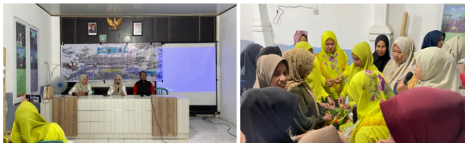
Gambar 2. Pemaparan materi pembuatan eco-enzyme kepada peserta pelatihan.

Pada tahap sosialisasi, penyampaian materi dilakukan melalui ceramah interaktif dan diskusi, sebagaimana ditunjukkan pada Gambar 2 (Pemaparan Materi sekaligus praktek lapangan pembuatan eco-enzyme). Peserta diberikan pretest sebelum penyuluhan dan posttest setelah materi selesai disampaikan. Hasil pengukuran menunjukkan adanya peningkatan pengetahuan yang cukup signifikan: rata-rata skor awal peserta sebesar 31% meningkat menjadi 69% pada saat posttest. Peningkatan hampir dua kali lipat ini menunjukkan bahwa informasi yang diberikan dapat diterima dengan baik oleh peserta dan mendukung temuan Adri et al. (2020) serta Febriani & Matsum (2015) mengenai efektivitas penggunaan pretest–posttest sebagai alat evaluasi pembelajaran. Dengan kata lain, penyuluhan berfungsi tidak hanya sebagai media transfer pengetahuan, tetapi juga sebagai pemicu perubahan perilaku awal dalam memandang limbah organik rumah tangga.