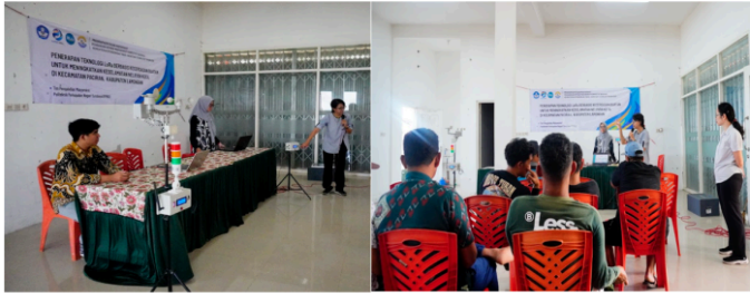
Gambar 3. Sosialisasi aspek keselamatan berlayar

Sosialisasi diikuti oleh 32 orang nelayan, pekerja galangan kapal dan pengurus Rukun Nelayan Kandangsemangkon. Kegiatan ini menekankan pada pentingnya budaya keselamatan kerja dan memperkenalkan manfaat penggunaan teknologi. Hasil pre-test menunjukkan 91% peserta sosialisasi dan pelatihan memperoleh pemahaman dasar mengenai pentingnya aspek keselamatan berlayar melalui penggunaan teknologi GPS Forelite.