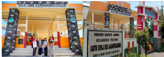
Gambar 1. Lokasi kegiatan pengabdian masyarakat

Kegiatan pengabdian dilaksanakan di 18 sa Kandang Semangkon, Kecamatan Paciran, Kabupaten Lamongan, Jawa Timur. Lokasi ini dipilih karena sebagian besar penduduknya bekerja sebagai nelayan kecil dengan kondisi sarana keselamatan yang masih terbatas. Kegiatan dilaksanakan selama 12 aun anggaran 2025, mulai bulan Juni hingga September 2025 dengan tahapan meliputi persiapan, sosialisasi, pelatihan dan penerapan teknologi, pendampingan, serta evaluasi.