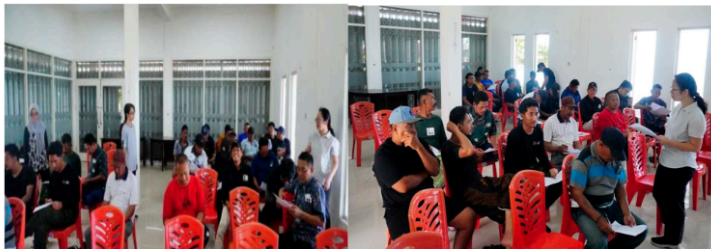
Gambar 4. Diskusi dan pendampingan

Sebanyak 32 orang peserta mengikuti demontrasi penggunaan alat dan pelatihan Materi pelatihan mencakup cara membaca koordinat GPS, penggunaan tombol darurat, interpretasi notifikasi kebocoran, serta pemanfaatan data rute untuk efisiensi bahan bakar. Hasilnya menunjukkan bahwa nelayan memahami cara kerja dan penggunaan alat dengan mudah karena nelayan sudah pernah menggunakan alat serupa namun dengan fitur yang belum optimal sesuai kebutuhan nelayan.