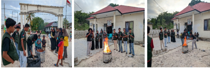
Gambar 3. Sosialisasi dan Demonstrasi Tong Sampah Minim Asap (Sumber: Dokumentasi Kegiatan, 2025).

4 masyarakat. Hasil uji coba menunjukkan bahwa tong mampu mereduksi volume sampah secara signifikan dan mengurangi intensitas asap yang keluar dibandingkan dengan pembakaran terbuka.