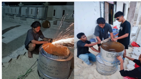
Gambar 2. Pembuatan Tong Sampah Minim Asap

Tahap persiapan menjadi fondasi keberhasilan kegiatan. Pada tahap ini dilakukan identifikasi permasalahan melalui survei lapangan dan diskusi awal bersama perangkat desa serta tokoh masyarakat. Hasil identifikasi menunjukkan bahwa permasalahan utama desa adalah penumpukan sampah dan kebiasaan pembakaran terbuka yang menghasilkan polusi udara. Berdasarkan temuan tersebut, tim merancang solusi berupa tong pembakar sampah minim asap. Desain alat disesuaikan dengan kondisi lokal dan memanfaatkan bahan daur ulang yang mudah diperoleh, sehingga biaya pembuatan relatif rendah. Selain itu, persiapan juga meliputi perencanaan metode sosialisasi, pembagian peran tim, serta penyusunan materi edukasi terkait dampak pembakaran sampah terbuka terhadap lingkungan dan kesehatan.