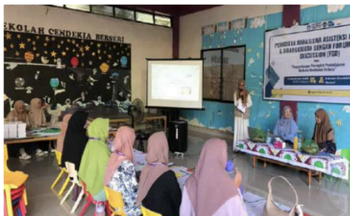
Gambar 2. Kegiatan Pembukaan

merupakan proses yang kompleks dan multidimensional. Pengembangan perangkat pembelajaran tidak hanya melibatkan aspek teknis, tetapi juga aspek pedagogis, psikologis, dan sosial.