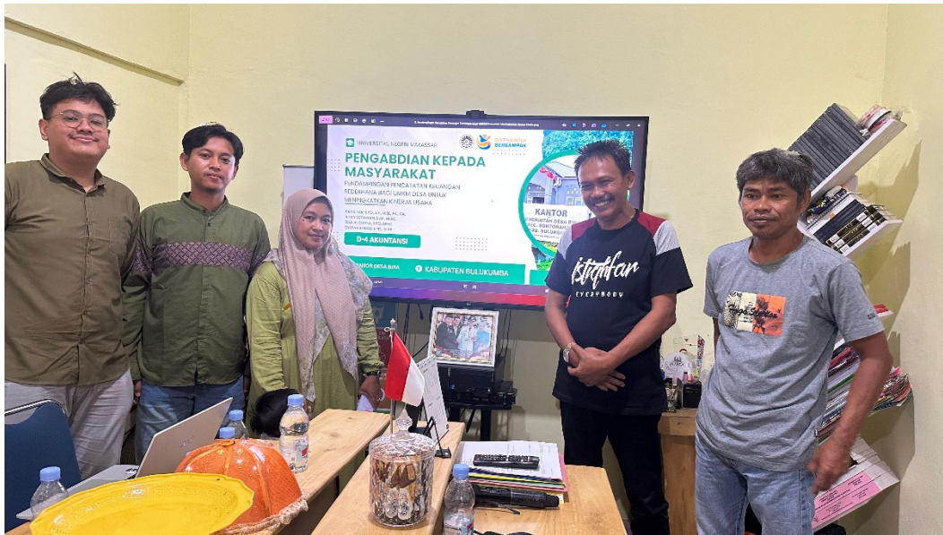
Gambar 3. Foto Bersama Dengan Pelaku UMKM

Hasil pendampingan menunjukkan bahwa pelaku UMKM mulai terbiasa mencatat transaksi harian secara teratur dan mengelompokkan transaksi berdasarkan jenis pemasukan dan pengeluaran. Mereka juga mulai mampu menyusun administrasi bukti transaksi secara lebih rapi dan teratur. Karena setiap UMKM memiliki kondisi dan karakteristik usaha yang berbeda, pendampingan individu memberikan dampak positif. Dengan memberikan bimbingan secara langsung, pelaku UMKM dapat memahami praktik pembukuan yang sesuai dengan kebutuhan usaha mereka. Bimbingan ini juga meningkatkan motivasi dan kesadaran pelaku UMKM terhadap pentingnya pengelolaan keuangan yang baik untuk mendukung pertumbuhan usaha mereka.