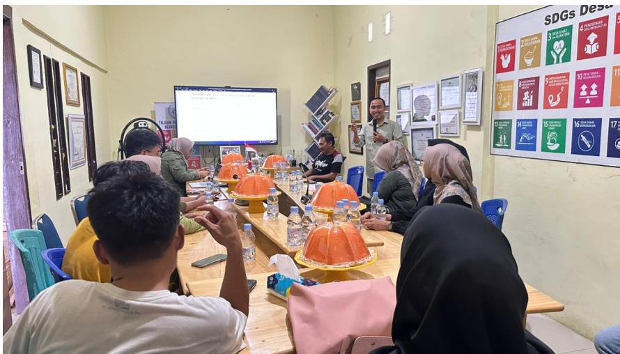
Gambar 2. Penyampaian Materi Oleh Tim Pengabdian Kepada Masyarakat

Hasil dari tahap pelaksanaan menunjukkan bahwa sebagian besar peserta telah mampu melakukan pencatatan transaksi sederhana secara mandiri sesuai format yang diberikan selama pelatihan.