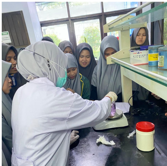
Gambar 2. Eksperimen Sederhana di Laboratorium

Pada tahap awal kegiatan, siswa diperkenalkan dengan berbagai peralatan laboratorium dasar seperti gelas ukur, buret, pipet, labu ukur, dan alat pemanas. Penjelasan tidak hanya mencakup nama alat, tetapi juga fungsi serta prosedur penggunaan yang benar dan aman. Melalui pendekatan demonstrasi langsung, siswa dapat mengamati bentuk dan cara penggunaan alat secara nyata sehingga mempermudah pemahaman siswa dibandingkan pembelajaran teoritis di kelas (Shao et al., 2024). Antusiasme siswa terlihat dari banyaknya pertanyaan yang diajukan terkait fungsi dan perbedaan masing-masing alat laboratorium.