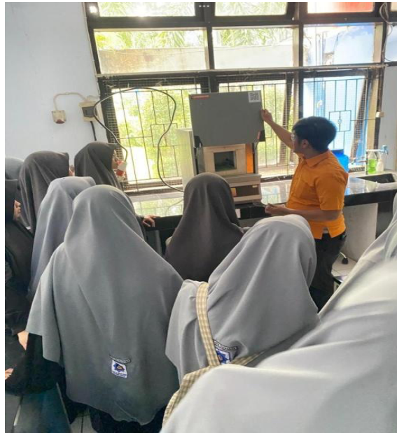
Gambar 1. Pengenalan Alat-alat Laboratorium

Pada tahap awal kegiatan, siswa diperkenalkan dengan berbagai peralatan laboratorium dasar seperti gelas ukur, buret, pipet, labu ukur, dan alat pemanas. Penjelasan tidak hanya mencakup nama alat, tetapi juga fungsi serta prosedur penggunaan yang benar dan aman. Melalui pendekatan demonstrasi langsung, siswa dapat mengamati bentuk dan cara penggunaan alat secara nyata sehingga mempermudah pemahaman siswa dibandingkan pembelajaran teoritis di kelas (Shao et al., 2024). Antusiasme siswa terlihat dari banyaknya pertanyaan yang diajukan terkait fungsi dan perbedaan masing-masing alat laboratorium.