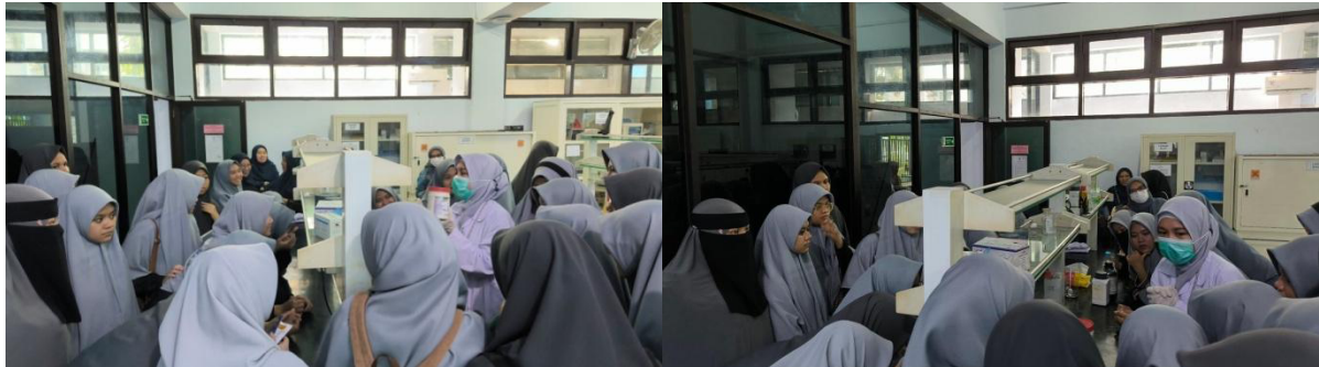
Gambar 3. Evaluasi Kegiatan

Rizki et al., 2024). Partisipasi aktif siswa selama kegiatan menunjukkan bahwa pengalaman langsung di laboratorium mampu meningkatkan ketertarikan mereka terhadap pembelajaran sains berbasis eksperimen.