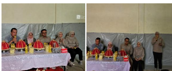
Gambar 3. Dokumentasi Pelaksanaan Pengabdian

Pada tahap pelatihan, kegiatan dilakukan melalui metode praktik langsung ( learning by doing ), sehingga peserta tidak hanya memperoleh pemahaman teoritis tetapi juga pengalaman praktis dalam proses produksi. Pelatihan meliputi teknik pengolahan nanas menjadi selai, minuman nanas, dan buah potong siap jual. Peserta juga diajarkan teknik pemilihan bahan baku, proses sanitasi pangan, pengolahan, hingga teknik pengemasan sederhana. Pendekatan praktik langsung terbukti mampu meningkatkan keterampilan teknis peserta secara lebih efektif dibandingkan metode ceramah semata. Selama proses pelatihan, peserta terlihat aktif berdiskusi dan mencoba setiap tahapan produksi secara mandiri.