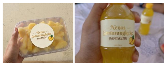
Gambar 3. Inovasi Produk Olahan Nanas

Peningkatan nilai tambah produk terjadi karena proses pengolahan mampu mengubah komoditas primer yang sebelumnya dijual dalam bentuk segar menjadi produk dengan nilai ekonomi yang lebih tinggi. Pelatihan produksi meningkatkan kemampuan teknis peserta dalam menghasilkan produk yang lebih beragam dan berkualitas. Selain itu, pengemasan dan pelabelan yang lebih baik meningkatkan daya tarik produk di mata konsumen, sedangkan pemasaran digital membuka peluang pasar yang lebih luas. Dengan demikian, kombinasi aspek produksi, pengemasan, dan pemasaran menjadi faktor penting dalam meningkatkan daya saing produk olahan nanas serta dan membuka peluang pengembangan usaha berbasis rumah tangga secara berkelanjutan.