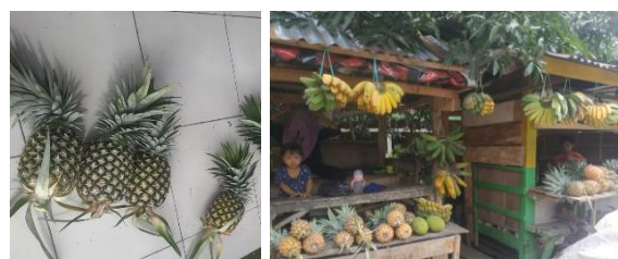
Gambar 1. Kondisi Eksisting di Kelurahan Gantarangeke

untuk memperluas jangkauan pasar. Dengan demikian, permasalahan yang ada tidak hanya bersifat teknis produksi, tetapi juga mencakup aspek manajerial dan pemasaran. Hal ini sejalan dengan pengabdian sebelumnya yang menunjukkan bahwa pemberdayaan masyarakat melalui pelatihan pengolahan pangan lokal dapat meningkatkan kapasitas usaha dan membuka peluang ekonomi baru berbasis UMKM (Leswana et al., 2025).