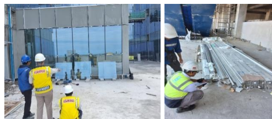
Gambar 2. Observasi Lapangan dan Identifikasi Tata Letak Material pada Area Kerja Vendor

Kegiatan pengabdian dilaksanakan melalui tahapan edukasi, pelatihan, serta pendampingan langsung dalam penataan tata letak material pada area kerja vendor proyek konstruksi gedung. Hasil kegiatan menunjukkan adanya peningkatan pemahaman peserta serta perbaikan signifikan pada efisiensi aliran material setelah implementasi.