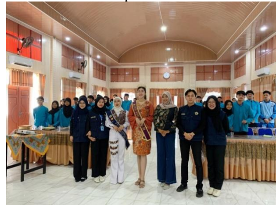
Gambar 1. Dokumentasi Bersama Pemateri

Kebudayaan Bengkulu yang didokumentasikan pada Gambar 1 .