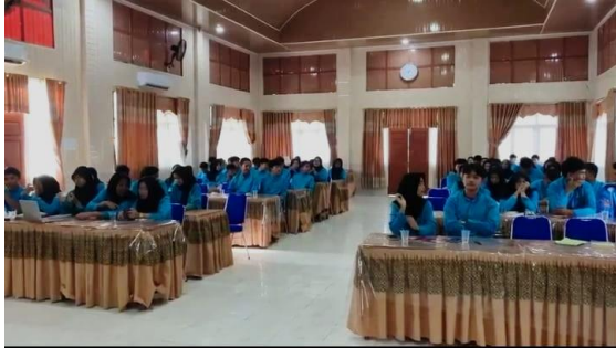
Gambar 3. Dokumentasi Peserta Kegiatan

yang mengetahui tentang aksara ulu namun kurang dalam penulisannya. Oleh karena itu perlu adanya pelatihan penulisan aksara ulu lebih lanjut, hal ini meliputi bagaimana cara menulis, bagaimana tanda baca dan yang paling penting adalah lebih mengenal dan memahami huruf aksara ulu.