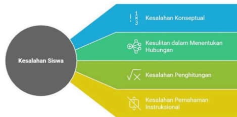
Gambar 4 Jenis Kesalahan siswa dalam materi aljabar

Berdasarkan gambar 4 Jenis kesalahan konseptual diuraikan serta dari pembahasan indikator 1 (kesalahan yang disebabkan oleh ketidakmampuan siswa untuk memahami konsep yang relevan dengan pertanyaan yang diberikan) termasuk kesalahan dengan tidak memberikan jawaban pada pertanyaan, kesalahan dengan hanya menulis kembali pertanyaan, kesalahan dengan tidak mengikuti langkah-langkah yang tepat untuk mendapatkan jawaban yang benar, dan kesalahan dengan tidak dapat menerapkan konsep aritmatika sosial. Sebuah penelitian yang dilakukan oleh (Roselizawati & Shahrill, 2014)