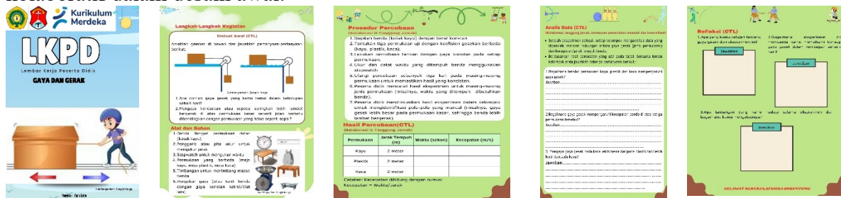
Gambar 2. Representasi Visual Rancangan Awal LKPD Fisika