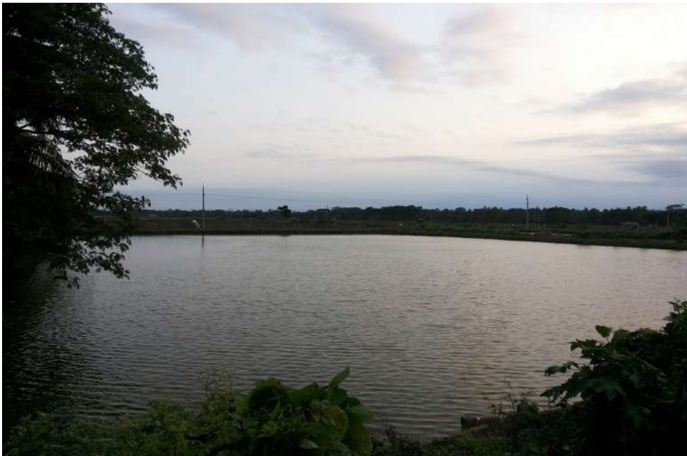
Gambar 1. Lokasi penelitian di Danau Mawang Kabupaten Gowa

Selain memiliki fungsi ekologis, Danau Mawang juga memiliki potensi sosial dan ekonomi bagi masyarakat setempat, antara lain sebagai lokasi kegiatan wisata lokal dan perikanan air tawar.