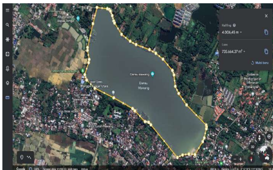
Gambar 2. Titik pengambilan sampel

Interpretasi dilakukan untuk menentukan tingkat pencemaran mikrobiologis dan menilai kelayakan Danau Mawang sebagai sumber air baku berdasarkan konsentrasi coliform yang diperoleh.