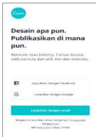
Gambar 5 Tampilan awal Canva