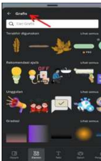
Gambar 2 Elemen Grafis

Canva dilengkapi dengan fitur yang memuat elemen pendukung elemen desain. Dengan memasukkan kata kunci ke dalam bagian pencarian, elemen yang Anda cari akan mudah ditemukan, dan ketika Anda mengkliknya, Anda akan dapat langsung menggunakannya. Melalui pemanfaatan aspek-aspek esensial tersebut, siswa mampu menyelesaikan desainnya dan membuatnya tampil lebih menarik. Siswa menggunakan elemen garis dan bentuk, grafis, foto, dan stiker sebagai pelengkap desain mereka. Oleh karena itu, program Canva menjadi lebih mudah digunakan oleh siswa. Tidak hanya karakteristik elemen yang dapat diakses, tetapi fitur font juga tersedia dalam berbagai bentuk dan gaya font. Hal ini mirip dengan situasi dengan perangkat lunak desain lainnya.