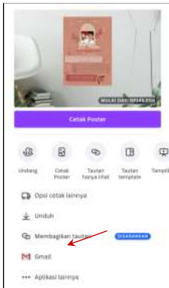
Gambar 10 Tampilan untuk menyimpan hasil karya desain

Dalam hal pengunduhan, Canva menawarkan file dalam format gif, pptx, jpeg, jpg, png, svg, pdf, dan mp4. Siswa dengan demikian dapat memilih format desain yang paling sesuai dengan kebutuhan mereka. Selain itu, ada dua versi PDF yang tersedia untuk dipilih. Pengguna tinggal memilih apakah akan menggunakan versi PDF khusus untuk dokumen atau untuk mencetak dokumen.