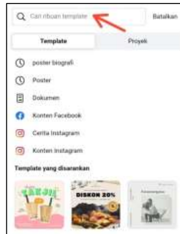
Gambar 8 Kolom Pencarian Template Menarik