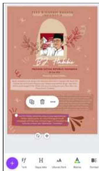
Gambar 9 Tampilan Desain Teks Biografi

Pada tahap edit, siswa dapat menambahkan beberapa gambar pahlawan sebelum memasukkan teks biografi. kemudian siswa mengedit latar belakang (background), mengatur warna sesuai dengan tema yang dipilih. Teks biografi yang disisipkan terlebih dahulu dipilah menurut struktur teks biografi tersebut. Khususnya bagian orientasi, peristiwa-peristiwa penting, dan bagian reorientasi. Selanjutnya siswa menambahkan teks dengan mengklik tanda (+) di pojok kiri bawah, mengklik bagian 'text', kemudian mengisi biodata yang telah disiapkan. Setelah mereka memasukkan semua konten, siswa terus mengedit font dan gambar agar selaras. Siswa juga menambahkan elemen grafis, bingkai, garis dan bentuk agar lebih menarik. Pada tahap ini siswa dapat menuangkan ide kreatifnya dalam mendesain gambar. Menyesuaikan tema, font yang digunakan, menambahkan gambar pahlawan, dan juga menambahkan elemen-elemen yang tersedia secara gratis di fitur Canva.