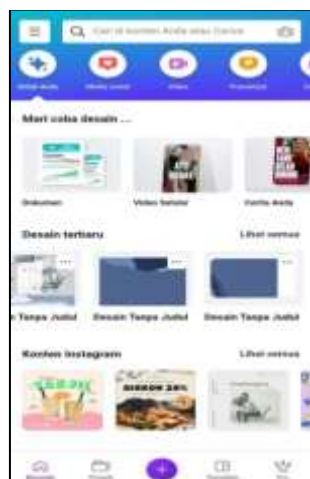
Gambar 6 Halaman depan dashboard

Setelah siswa membuat akun di program Canva, langkah-langkah berikut ini adalah agar mereka dapat memanfaatkan Canva untuk tujuan apa pun yang mereka perlukan. Untuk memulai desain di aplikasi Canva, siswa dapat memilih untuk "buat desain" atau langsung memilih template yang diinginkan di halaman depan dashboard.