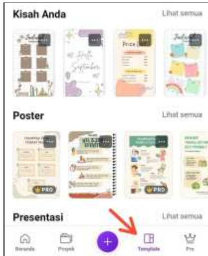
Gambar 7 Tampilan Pilihan Template Canva