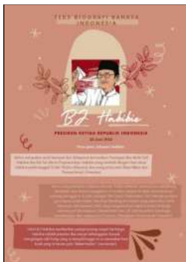
Gambar 12 Hasil Karya desain Canva