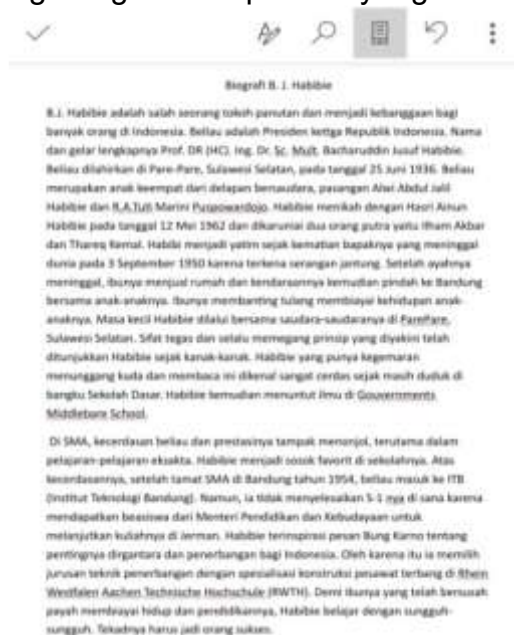
Gambar 3 Teks Biografi

sebuah karya biografi adalah rangkaian peristiwa yang mencakup pengalaman yang dialami tokoh, baik pengalaman luar biasa yang dialami tokoh maupun kesulitan yang dihadapi tokoh. Setelah itu, bagian akhir narasi biografi adalah reorientasi, yang memuat reaksi pengarang terhadap tokoh yang dibicarakan.