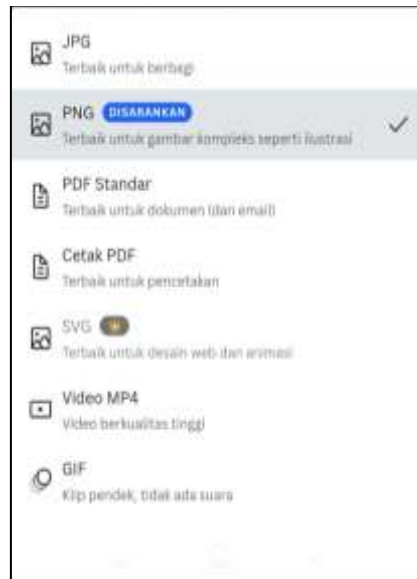
Gambar 11 Opsi ukuran file yang disimpan